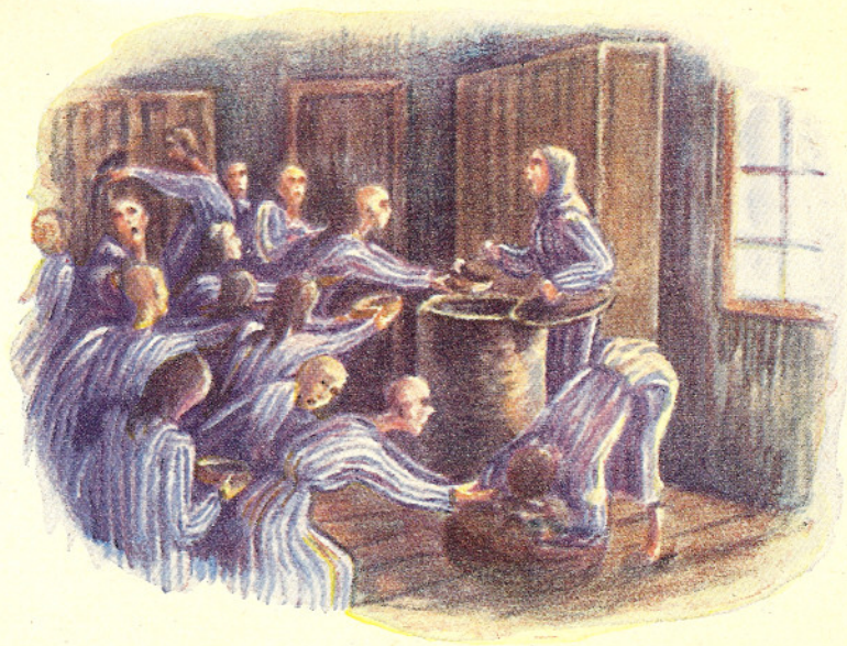
Обід — пісна юшка з води й лущиння картоплі.